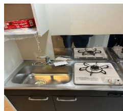
※写真は別部屋の参考写真となります。