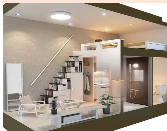
物件名:ハーモニーテラス北町II