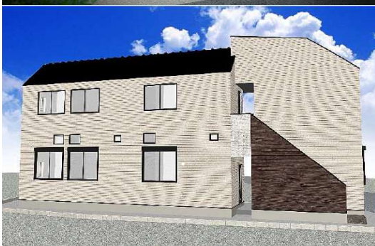
住宅(住棟) 再エネ設備なし