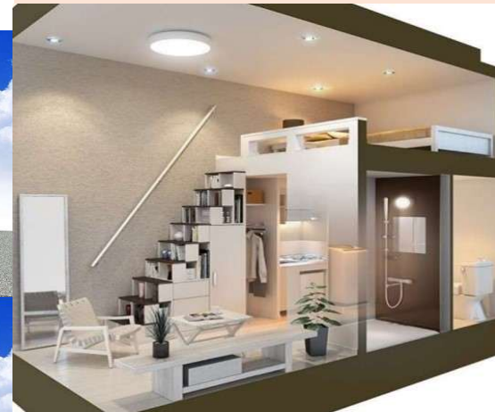
物件名:ハーモニーテラスときわ