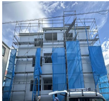
※図面と現況が異なる場合は現況を優先させていただきます