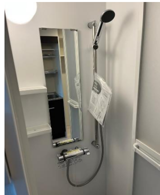
写真は別部屋の参考写真となります。