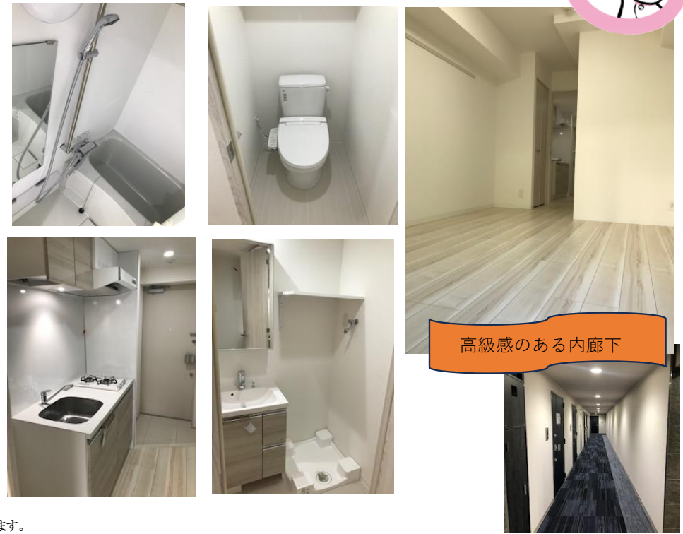
高級感のある内廊下

※写真は別部屋のものです。 ※図面と現況が異なる場合は現況を優先させていただきます。