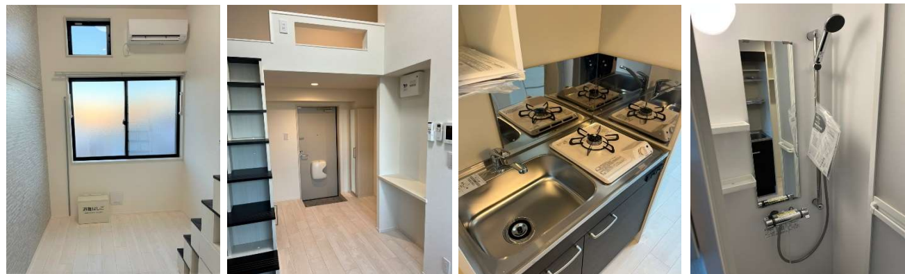
写真は別部屋の参考写真となります。